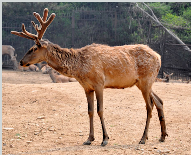
中国满州马鹿(又名四不像)