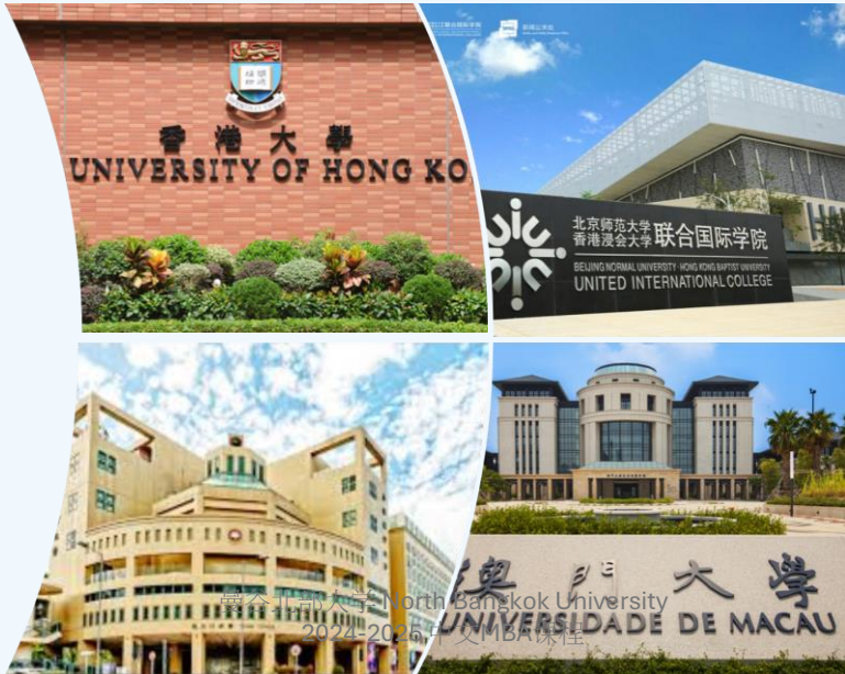
Universities in HK, Macau, and GBA 香港、澳门和 大湾区的大学