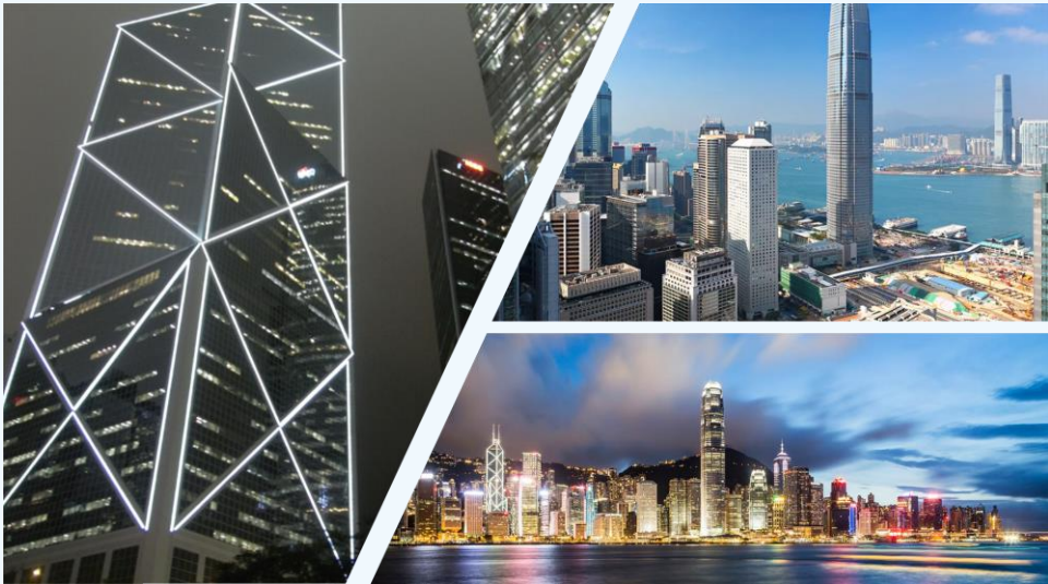
Hong Kong 香港

本 MBA 课程包含安排参观香港、澳门或大湾区的大学和当地企业（银行、国有或私营企业）